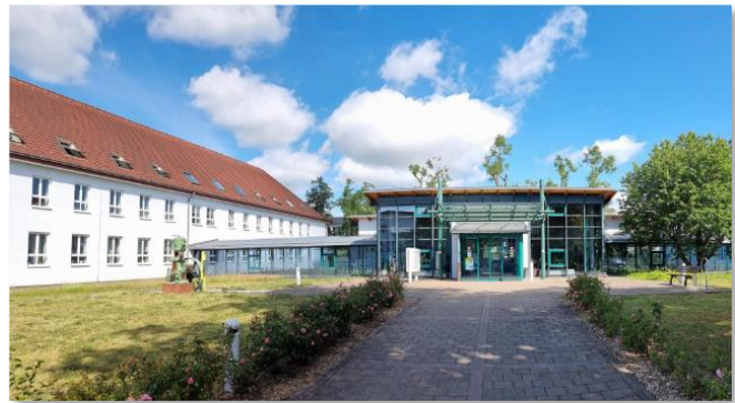
Firmensitz im Merseburger Innovations- und Technologiezentrum

Die brain-SCC GmbH ist ein bundesweit tätiger IT- und Mediendienstleister mit Firmensitz in Merseburg. In einem modernen Arbeitsumfeld entwickeln wir seit mehr als 20 Jahren mit inzwischen über 35 Mitarbeitenden in hochmotivierten Teams mit flachen Hierarchien innovative Softwareprodukte für die Digitalisierung in der öffentlichen Verwaltung von Bund, Ländern und Kommunen. Die stetig wachsenden Anforderungen fließen in enger Abstimmung mit den Anwendern seit Jahren in die Konzeption, Entwicklung und den Betrieb der Produktgruppen rund um unser brain-GeoCMS® ein. Damit verfügt die brain-SCC GmbH mit ihren innovativen hauseigenen Lösungen über umfassende Kompetenzen bei der Umsetzung von Onlinediensten im Rahmen des Onlinezugangsgesetzes (OZG) nach dem „EfA“-Prinzip und als nachnutzbare Onlinedienste in Serviceportalen („Mini-EfA“) sowie bei der Realisierung von Kommunalportalen und Geografischen Informationssystemen.