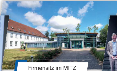
Firmensitz im MITZ